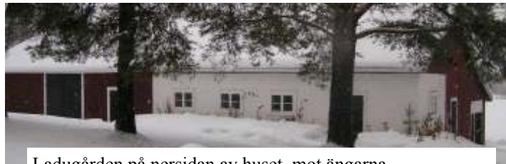
Ladugården på nersidan av huset, mot ängarna.

Huset är byggt ca 1943 och familjen köpte huset 1993 .